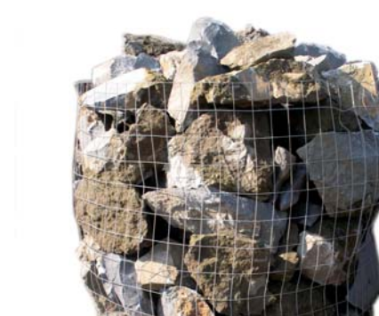
TEFRAROCK Pietra lavica in tonalità grigio-nera 20-50 cm.