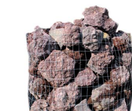
TEFRAROCK Pietra lavica in tonalità rosso-viola 50/100 cm.