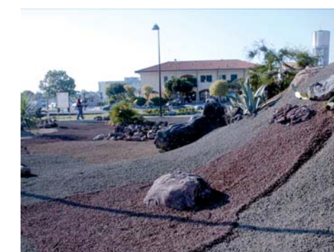
CERVIA (RA) Realizzazione di pacciamatura con TEFRARED e TEFRABLACK

Tefrablack è un prodotto naturale derivato dalla frantumazione e vagliatura di lave vulcaniche di colorazione nero-grigiastria, caratterizzate da elevata porosità e resistenza strutturale. Tefrablack possiede tra il 40% e il 60% di vuoti per ogni granulo, è resistente al gelo, chimicamente inerte, insolubile, inodore, atossico ed esente da silice reattiva, contaminanti organici e minerali rigonfiati a contatto con l'acqua. Per le sue caratteristiche, Tefrablack può essere usato come pacciamatura o come elemento decorativo da giardinaggio creando uno splendido effetto estetico.