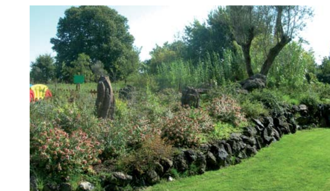
CESANO (RM) - SUTRI (VT) Muri a secco con TEFRAROCK e pietre ornamentali