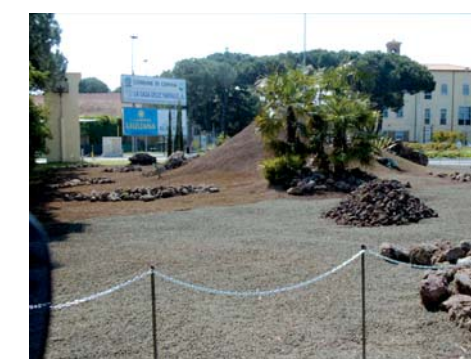
CERVIA (RA) Realizzazione di pacciamatura con prodotti TEFRADÉCOR

Tefrabrown è un prodotto naturale derivato dalla frantumazione e vagliatura di lave vulcaniche di colore marrone, caratterizzate da elevata porosità e resistenza strutturale. Tefrabrown possiede tra il 40% e il 60% di vuoti per ogni granulo, è resistente al gelo, chimicamente inerte, insolubile, inodore, atossico ed esente da silice reattiva, contaminanti organici e minerali rigonfiati a contatto con l'acqua. Per le sue caratteristiche, Tefrabrown può essere usato come pacciamatura o come elemento decorativo da giardinaggio creando uno splendido effetto estetico.