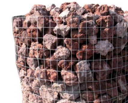
TEFRAROCK Pietra lavica in tonalità di rosso 10/20 cm.