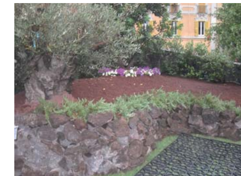
RONCIGLIONE (VT) Esposizione alla mostra mercato "Sbocciano i Borghi" 2011

Tefrare è un prodotto naturale derivato da frantumazione e vagliatura di lave vulcaniche che oltre ad avere elevata porosità e resistenza strutturale presentano un particolare colore che va dal rosso al violetto. Tefrare , come tutti i prodotti tefralite, possiede tra il 40% e il 60% di vuoti per ogni granulo, è resistente al gelo, chimicamente inerte, insolubile, inodore, atossico ed esente da silice reattiva, contaminanti organici e minerali rigonfiati a contatto con l'acqua. Per le sue caratteristiche, Tefrare è ideale per la pacciamatura, la pratica di giardinaggio di ricoprire il suolo intorno alle piante con uno strato protettivo che impedisce la formazione di erbe infestanti senza soffocare il terreno. La pacciamatura con Tefrare supporta le colture con numerosi effetti benefici: protegge dall'erosione, riduce la compattazione del terreno a causa dell'azione battente dell'acqua, conserva l'umidità regolando l'evaporazione con conseguente riduzione di apporti idrici esterni, mitiga la temperatura del suolo evitando gli sbalzi termici, contrasta la germinazione dei semi delle piante infestanti, preserva frutti e verdure dagli schizzi di terra causati dalle annaffiature, permette di calpestare il terreno e lavorarlo anche umido senza produrre compattazione e senza infangarsi, donando un aspetto gradevole e ordinato ad orti e giardini.